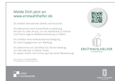
POSTKARTE / FLYER DIN A6