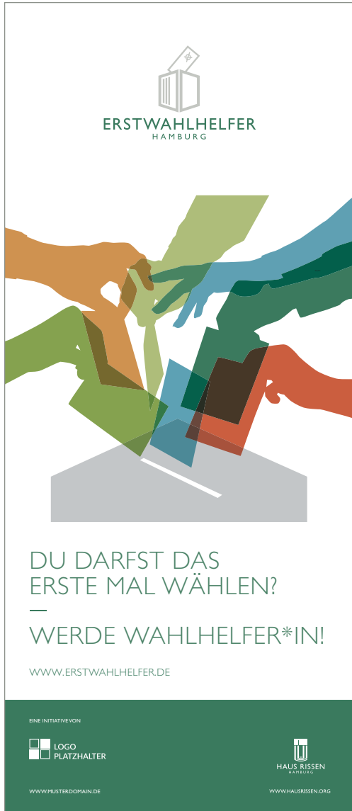
ROLL-UP 85 X 200 cm