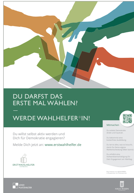
PLAKAT DIN A2